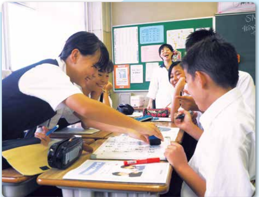
「ルールづくりの話合い」の様子 (中学校)